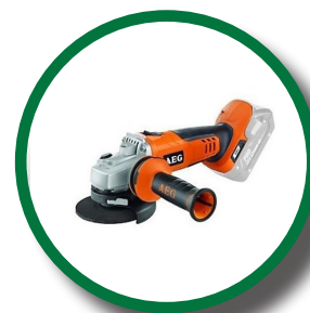
Pour meuleuses angulaires avec ou sans fil

Le UG25 est un disque diamant haut de gamme, forte concentration de diamants (de haute qualité). Disque diamant pour granit et la pierre, il se distingue par sa puissance et sa maniabilité.