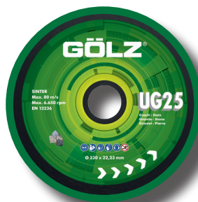
Alésage 22,23 (Autres alésage sur demande)