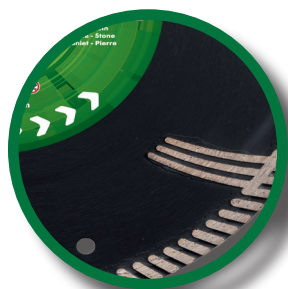
Disque à bandeau turbo avec protection anti-abrasion