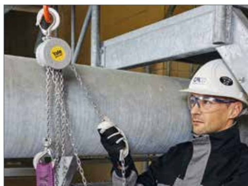
Application de tirage