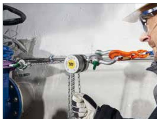
Application de levage