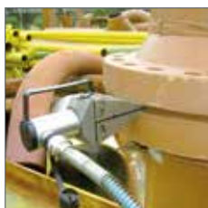
Coins hydrauliques modèle YSW-14T, 14t