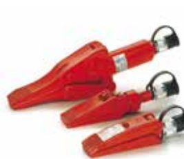
Vérins écarteurs modèle YHS, 0.5-1.5t