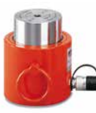
Vérins plates et extra-plats modèle YLS and YFS, 10-100t