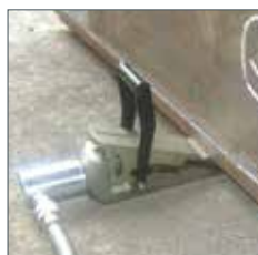
Écarteurs pour levage verticale modèle HK-16T, 16t