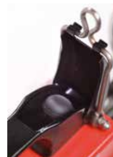
Utilisation à une seule main bouton intégré dans la poignée ergonomique.