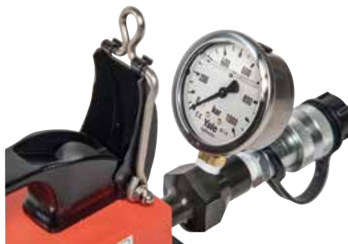
Pompe électrique sans fil modèle PYB-1,0 avec option manomètre GYA-63

Les manomètres adaptés avec raccords correspondants sont présentés dans ce catalogue. (option)