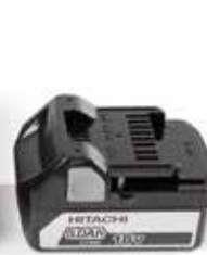
Batterie modèle PYB-BAT