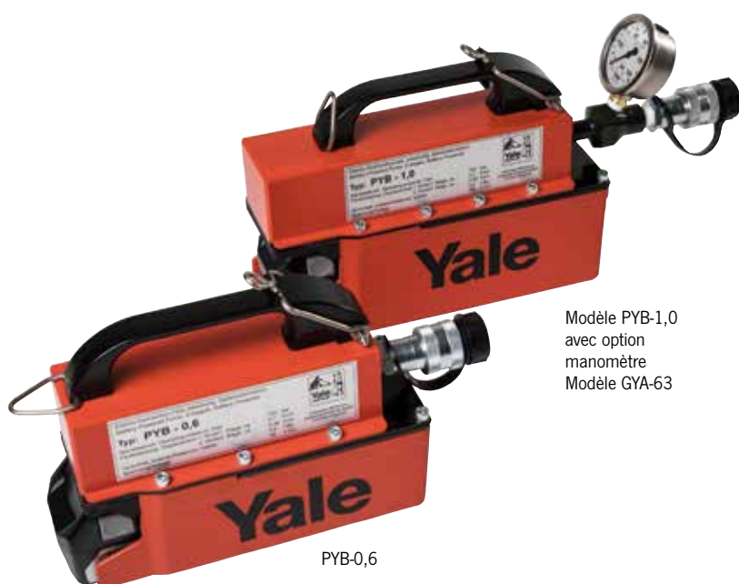
Modèle PYB-1,0 avec option manomètre Modèle GYA-63