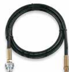
Flexible hydraulique modèle HHC