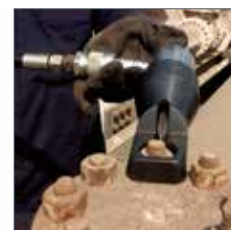
Casses écrous modèle YNS/YNS-AH, SW 11-89mm