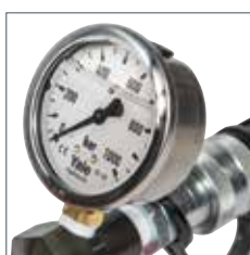
Kit manomètre en option modèle GYA-63