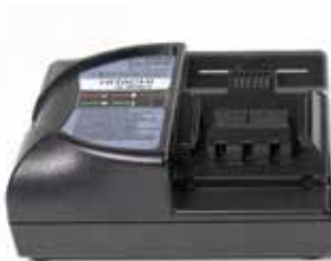
Chargeur modèle PYB-CHARG