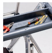
Tablette porte-outils grande capacité