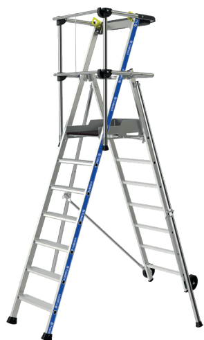
Modèle 7 marches

Cette PIR-PIRL en aluminium est disponible de 3 à 8 marches, elle s'impose comme étant la référence des plate-formes sécurisées. Ses montants renforcés, sa plate-forme large, ses stabilisateurs réglables, son garde-corps rigide semi-automatique, font du Sherpamatic un produit extrêmement robuste et stable. Il dispose d'un porte-outils, de roues de déplacement et de marches de 80 mm. Il répond aux normes PIR - PIRL et EN 131-7, au décret 2004-924 et est labellisé NF.* Le modèle 3 marches n'a pas de stabilisateurs.