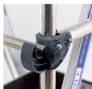
Blocage très fiable du portillon