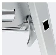
Verrous arrière anti-soulèvement