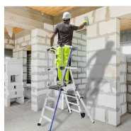
Stabilisateurs avec réglage millimétrique