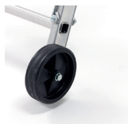
2 roulettes Ø 160 mm pour les déplacements