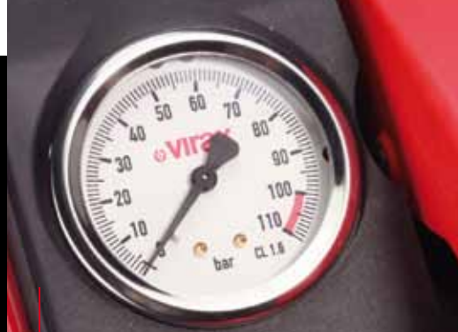
Manomètre 100 bar