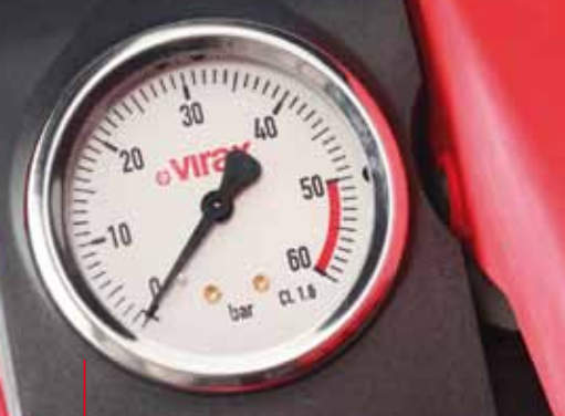
Manomètre 50 bar