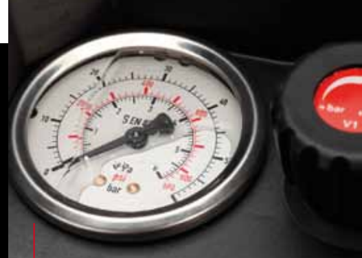
Manomètre à glycérine