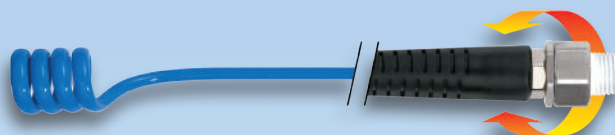
Raccord rotatif monté sur roulement à billes côté outil pneumatique : rotation aisée même sous pression

Pour les applications sévères, nous recommandons l'utilisation de tuyaux spirales polyuréthane PUS FF équipés de raccord fixe de chaque côté.