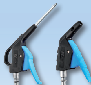
Produits associés : IBG 06MTL – IPG 06OSH