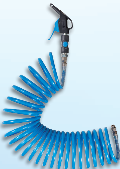
Raccords fixes aux deux extrémités du tuyau spiralé