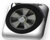
Grande roue, maintient facile