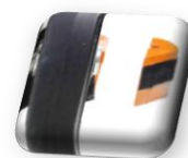
Ponçage à ras