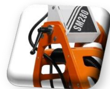
Poignée de manœuvre, pliage facile