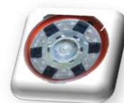
Outils de ponçage, 7 granulométries possibles (en option)