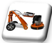
Machine repliable et démontable