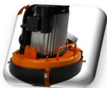
Moteur électrique 230 V, 50/60 Hz / 2,2 Kw