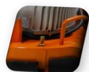
Raccordement externe à l'eau