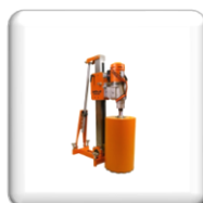
Carotteuse sur Bâti Électrique