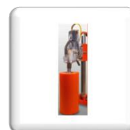
Carotteuse Haute Fréquence