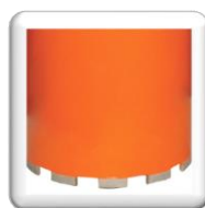
Segment Brasure à l'Argent H 10 mm