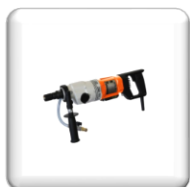
Carotteuse Portable Électrique