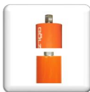
Raccord 1 1/4" UNC ou M41