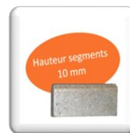
RM52 Segment Diamant – Excellence