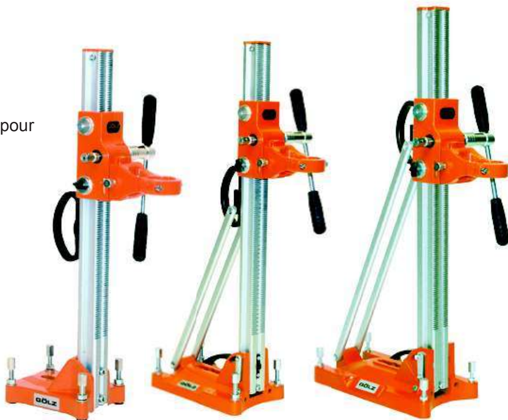
Bâti KB60 socle à cheviller