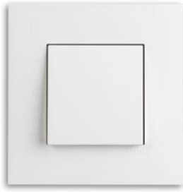
BM Blanc Mat