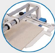
● Équerre. Square ruler.