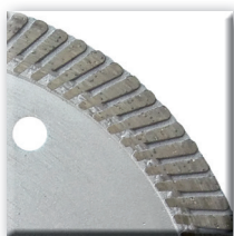
Jante continue avec segments frittés