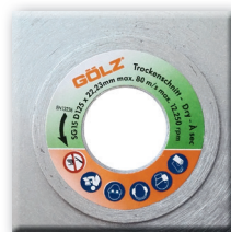
Alésage 22,2 Flasque renforcé