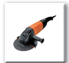
Disque spécial meuleuse filaire ou batterie