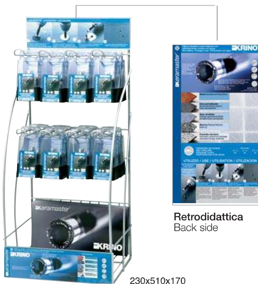
Retrodidattica Back side