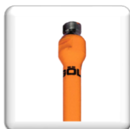
Raccord R 1/2"