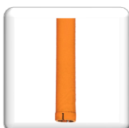
Couronne à anneau, Brasure à l'Argent, Hauteur 7 mm