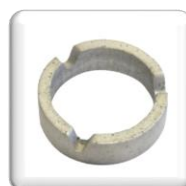
RS61 Anneau Diamant - Technique, Hauteur 7 mm