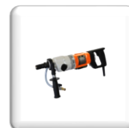
Pour Carotteuse à Eau