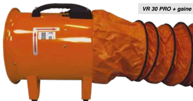
VR 30 PRO + gaine