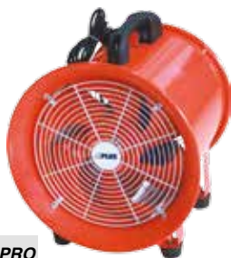
VG 30 PRO