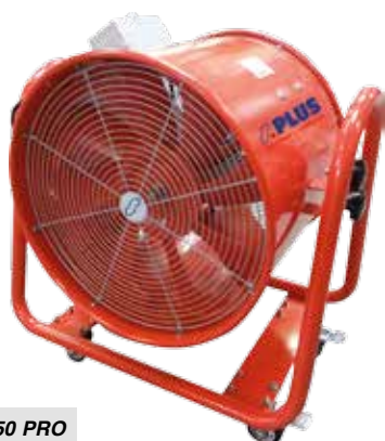
VR 50 PRO