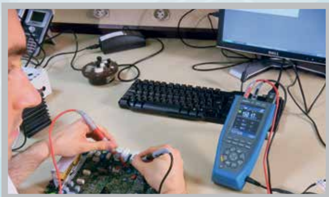
... ou en après-vente