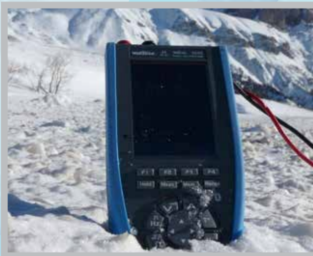
IP67, l'étanchéité des ASYC IV leur permet de couvrir des applications en environnements difficiles