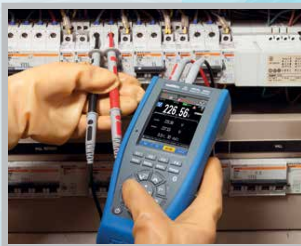
Mesures sur armoires électriques