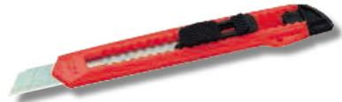
Cutter 18 mm ECO

Plastic behuizing Mesblokkering met drukknop. Met 1 lemmet