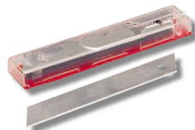
10 lames de cutter 18 mm

Gehard staal Verdeelletui met 10 lemmets. 7 afbreekbare elementen