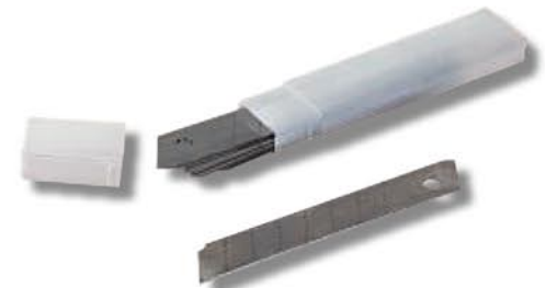
Boîte de 100 lames de cutter 18 mm

10 étuis de 10 lames. 7 éléments sécables 10 verdeelletuis met 10 lemmets. 7 afbreekbare elementen