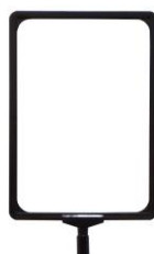
RSA4PN (en option)