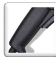
Poignée à étrier anti-vibrations