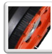
Taquet d'arrêt facilitant le changement de plateau