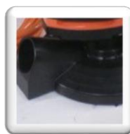
Entrée d'aspiration Raccord d'aspirateur