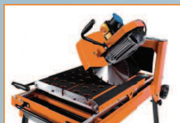
Tête inclinable à 45°