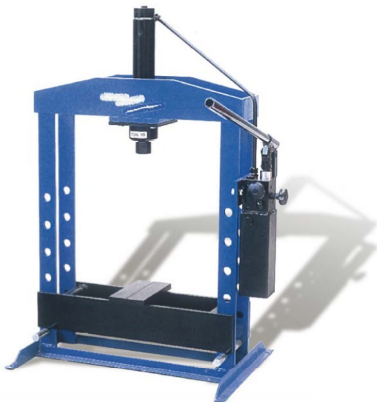
Modèle RPW 10EM