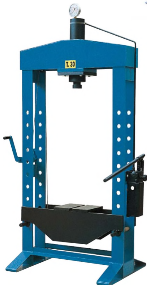
Modèle RPW 30CM